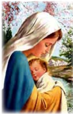
Benedetto il Signore che viene!